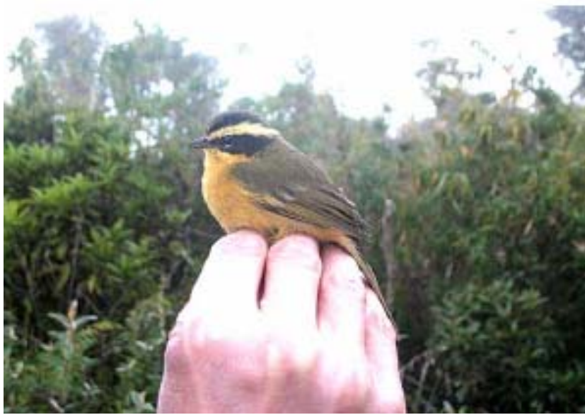
Hemispingus trifasciatus - Huayrackunca