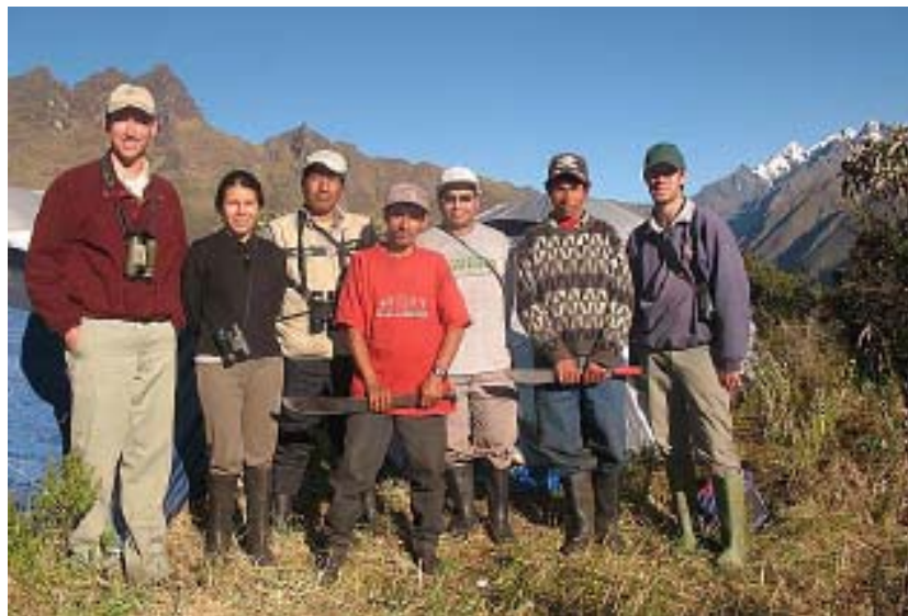
Equipo de campo - Huayrackunca