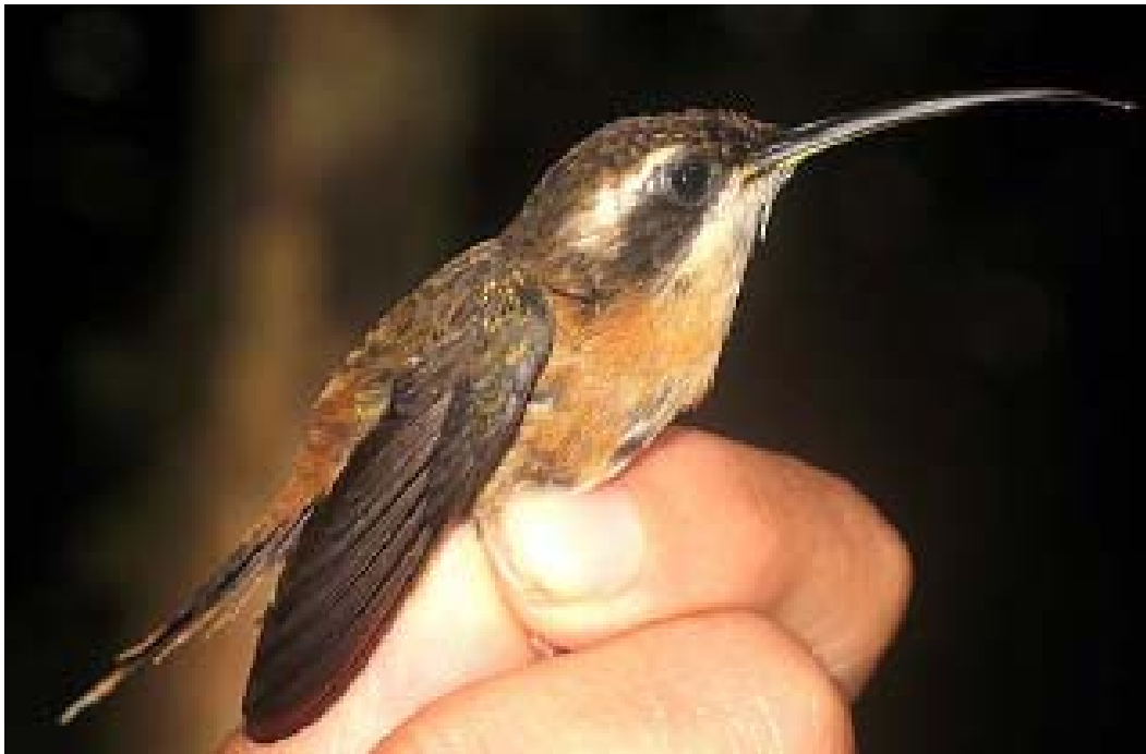
Phaethornis stuarti - Cerro Saucipata