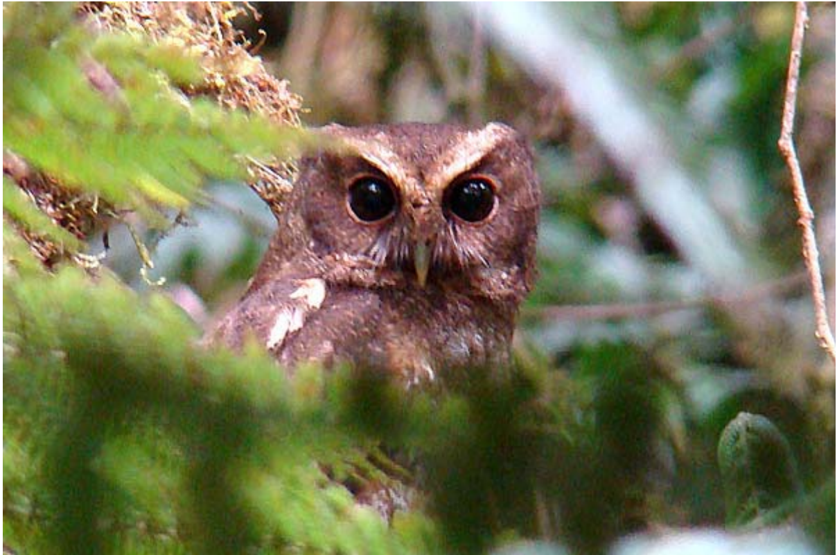
Megascops ingens - Cerro Saucipata